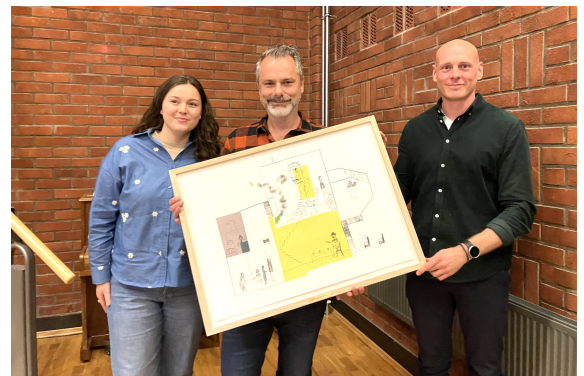
Fornøyde vinnere av NBU-prisen: Appelsinia-festivalen.