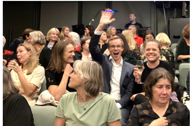
Feststemning på NBUs 75-årsjubileum i september.