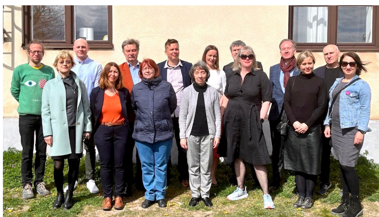
Deltakere på årsmøtet i Baltic Writers' Council.

Nordisk forfatter- og oversetterråd (NFOR) møttes i Oslo 12.–13. september 2022. DnF, NBU og NO var vertskap. Til stede var representanter fra flere andre nordiske forfatter- og oversetterforeninger. Representantene ga en kort rapport om situasjonen i deres land siden forrige NFOR-møte samt om hvilke saker de hadde fokus på. Noen av temaene som ble tatt opp på møtet, var gratisarbeid i bransjen, MeToo, boklov, skolebokreform, digitale læremidler, lydbok og strømming og krigen i Ukraina. Neste NFOR-møte vil avholdes i Finland i 2023.