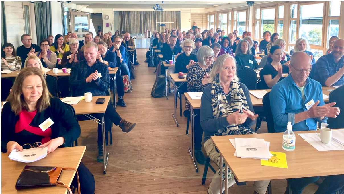
Medlemmer klapper i gang årsmøtet på Leangkollen i april 2022.

Balansekunst, Norsk Bibliotekforening, Landslaget for Norskundervisning, Foreningen lles, Kunstnernettverket, Leser søker bok, Norsk Forening for opphavsrett, Kopinor, Norwaco, Norsk Kritikerlag, European Writers' Council, Baltic Writers' Council