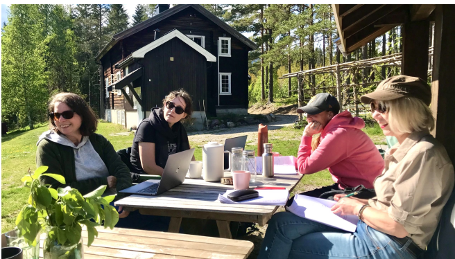
Inspirasjon i sola på NBUs skriveseminar i Bø.