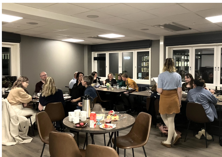
Det diskuteres iherdig: Quizlag på debutanttreff kjemper om seieren.